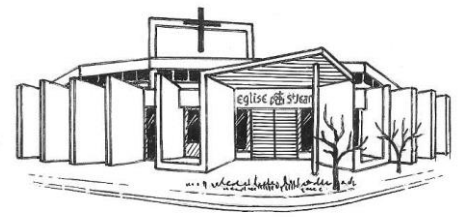
Église St-Jean 7 rue Jean Racine