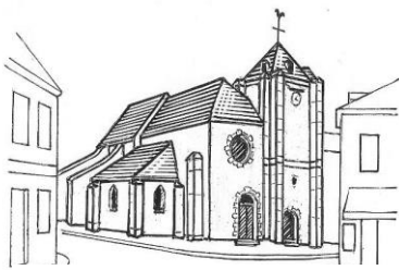
Église St-Nicolas Rue Jean Jaurès

Paroisse St-Nicolas 7 rue Jean Racine 94510 La Queue-En-Brie