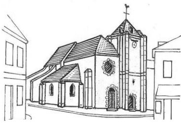
Eglise St-Nicolas Rue Jean Jaurès

Paroisse St-Nicolas 7 rue Jean Racine 94510 La Queue-En-Brie