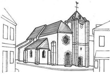
Eglise St-Nicolas Rue Jean Jaurès

Paroisse St-Nicolas 7 rue Jean Racine 94510 La Queue-En-Brie