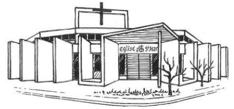
Eglise St-Jean 7 rue Jean Racine