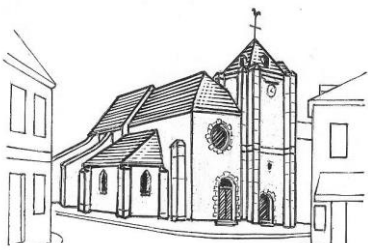
Eglise St-Nicolas Rue Jean Jaurès

Paroisse St-Nicolas 7 rue Jean Racine 94510 La Queue-En-Brie