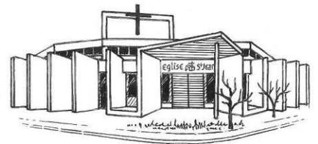
Eglise St-Jean 7 rue Jean Racine