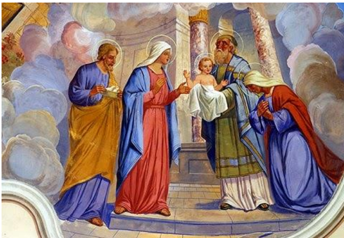
Présentation du Seigneur au Temple.