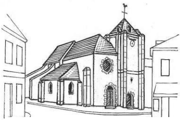
Eglise St-Nicolas Rue Jean Jaurès

Paroisse St-Nicolas 7 rue Jean Racine 94510 La Queue-En-Brie ☎ : 01.45.76.30.31