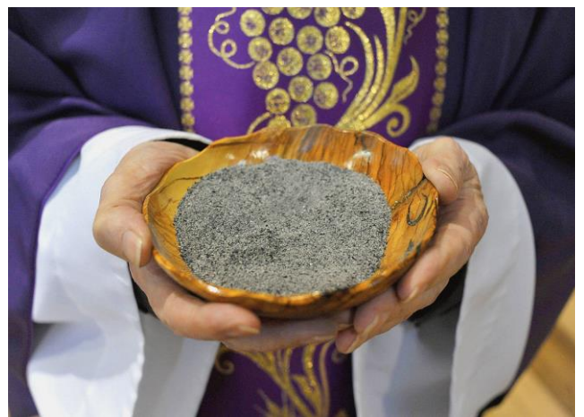
Les cendres, symbole de Carême.