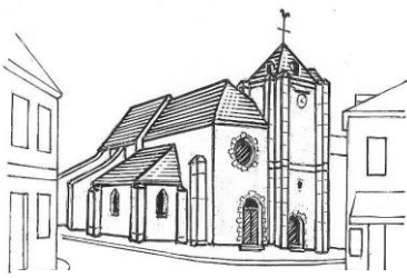
Eglise St-Nicolas Rue Jean Jaurès

Paroisse St-Nicolas 7 rue Jean Racine 94510 La Queue-En-Brie